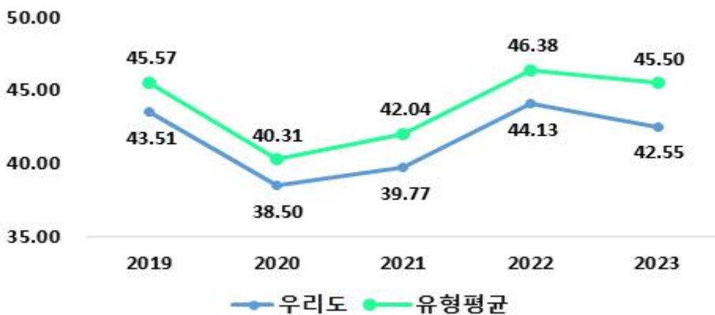
최근 5년 결산기준 재정자주도

※ '자주자원', '보전수입 등 및 내부거래' 및 '세입 합계'의 각 수치는 결산액에서 '전년도 이월 사업비'를 제외한 값입니다. 예산 기준 재정자주도 산정시 전년도 이월 사업비가 포함되지 않기 때문에 지표 간 비교를 위해 이를 제외하였습니다.